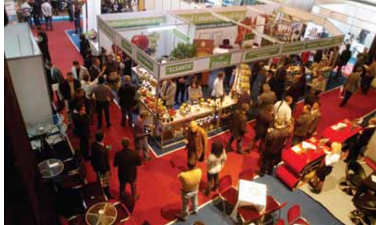
AGROKOS & DRINKS 2011

The opening of the fair was attended by a considerable number of personalities from