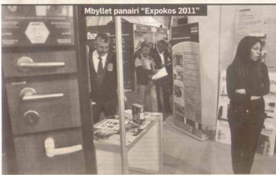
Mbyllet panairi "Expokos 2011"

Në panairin "EXPOKOS 2011", përveç prezantimit individual të qindra kompanive, do të marrin pjesë emra të njohur të firmave nga Sllovenia, të cilët mbështeten nga Agjencia për promovimin e eksportit, kompani nga Kroacia, të organizuara nga Oda Ekonomike e Kroacisë, pavijoni i kompanive nga Turqia, të mbështetura nga Qeveria turke, pavijoni i kompanive nga Bosnja, kompani nga Greqia bashkë me Odën Ekonomike të Kozanit, kompani prodhuese nga Kosova, të mbështetura nga USAID-i, pavijoni i kompanive nga Lugina e Preshevës, të mbështetura po ashtu nga USAID-i etj. Pjesëmarrës me standat e tyre do të jenë edhe Agjencia për Promovimin e Investimeve të Huaja në Kosovë (APIK) dhe Komisioni Italian i Tregtisë. Në panairin ?EXPOKOS? do të prezantohen produkte të shumëllojshme nga teknologjia e avancuar, nga prodhuesit më të njohur ndërkombëtarë të fushës së ndërtimit, energjetikës, makinerisë dhe përpunimit të drurit.